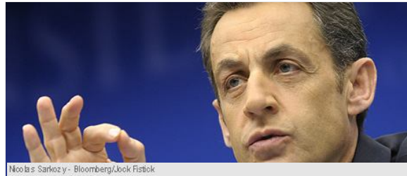
Nicolas Sarkozy

Le chef de l'Etat a annoncé des aides d'un montant de deux milliards d'euros pour consolider les fonds propres et encourager l'investissement des petites et moyennes entreprises.